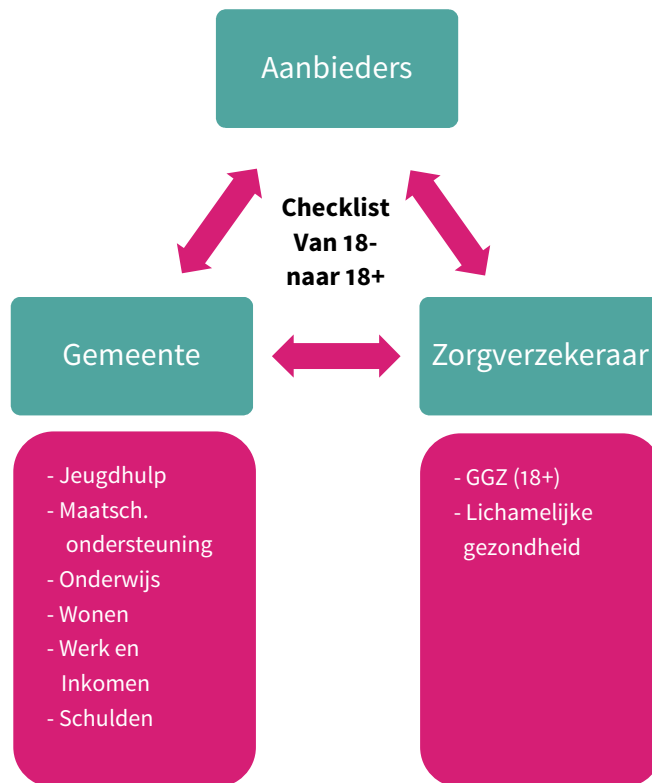
Figuur 2. De leefdomeinen waarop een ‘aanspreekpunt’ vanuit gemeente/ Menzis is aangewezen.